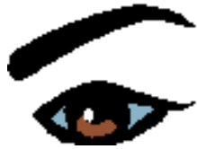
méi 眉 mù yǎnjīng 目(眼睛)