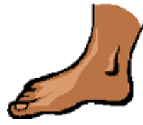
zú jiǎo 足(脚)